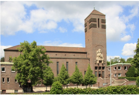
RENOVATION GEMEINDEHAUS ST. GEORG